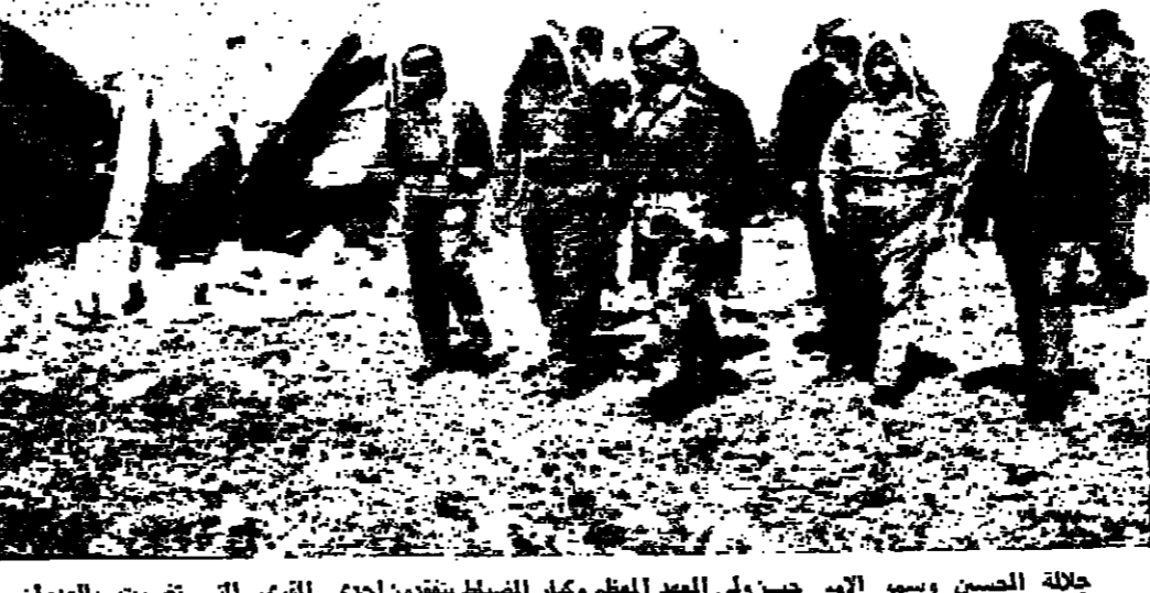
جلالة الصبح وسمو الامير حسني ولي العهد العظم وكبار الضباط ينتفضون إحدى القرى التي تضررت بالمعدون (الاصح - تصوير سبراميس)